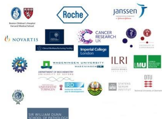
Figur 1. Urval av samarbetspartners och kunder

ExpreS 2 ion Biotechnologies affärsmodell är uppbyggd på ett sätt som gör att Bolaget dels kan marknadsföra licenser till ExpreS 2 -plattformen i sin helhet, men även delar av den och på så sätt låta kunden vara delaktig eller helt ansvarig för arbetet med att utveckla proteinerna som behövs. Bolaget kan också ta betalt för att själva, med hjälp av ExpreS 2 -plattformen, utveckla proteiner för kunders räkning och leverera proteinet som en färdig produkt. Bolaget har två huvudsakliga kategorier av kunder; dels läkemedelsbolag och dels forskningsinstitutioner. Bolaget vänder sig till båda dessa typer av organisationer eftersom ExpreS 2 -plattformen kan anpassas både för grundläggande akademisk forskning och kommersiell läkemedelsutveckling. Bolagets kunder har vidare ingen geografisk avgränsning, utan befinner sig redan i dagsläget i flera olika världsdelar. ExpreS 2 ion Biotechnologies har sedan starten år 2010 arbetat tillsammans med över 75 olika kunder. Avtalen med dessa kunder, som i många fall är världsledande universitet, forskningsinstitutioner och läkemedelsbolag, gör att Bolagets verksamhet redan i dagsläget har genererat betydande intäkter.